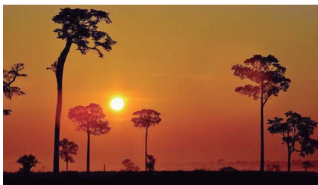
O Sol, fonte de energia comandará os destinos em 2016

ta da astróloga diz respeito à vida pessoal, independentemente do signo. “Para quem quer ter filhos, 2016 será um ano maravilhoso. Mas cuidado, porque mesmo quem não planejar, pode ter um bebê, e mais incrível ainda, se ver amando a experiência. O romance, sobretudo caloroso e demonstrativo, será valorizado de modo geral. Um ano para todos se cuidarem com relação a autoestima, aliás, esse cuidado deve ser maior que nos anos anteriores. O seu cuidado representa a nossa auto valorização”.